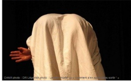
L'épave photo : La Mort morte ou « comment s'en sortir »

Théâtre / Agenda La Mort morte Laurent Mascles met en scène La Mort morte de Ghérasim Luca, analyse du néant insondable, volonté de maîtrise de l'irreprésentable et face-à-face avec sa tentation et son aveuglant mystère.